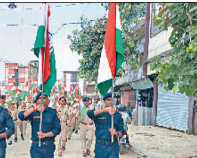
नारनौल। तिरंगा यात्रा निकालती पुलिस।

पुलिस ने हर घर तिरंगा अभियान के तहत सोमवार को एक भव्य पैदल तिरंगा रैली का आयोजन किया। जिसमें पुलिस अधिकारियों, जवानों, बाइक राइडर्स, साइक्लिस्ट व स्कूली बच्चों ने उत्साहपूर्वक भाग लिया। इस रैली का उद्देश्य स्वतंत्रता दिवस के उपलक्ष्य में देशभक्ति की भावना को बढ़ावा देना और