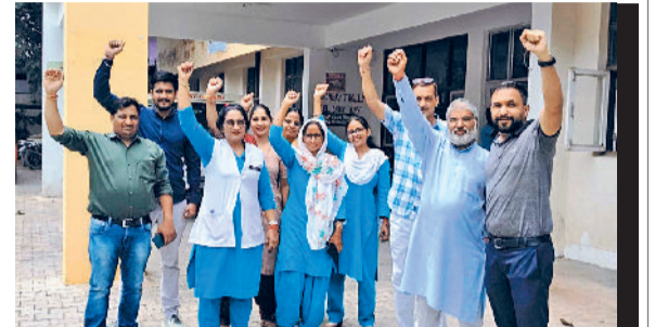
वेतन नहीं मिलने से एनएचएम कर्मचारी परेशान

उक्त सैद्धान्तिक स्वीकृति को 3 वर्ष 9 महीने बीत जाने पर भी आज तक लागू नहीं किया गया है, जिस कारण एनएचएम कर्मचारियों को सातवें वेतन का लाभ तो नहीं मिल पाया है, बल्कि इसके विपरीत 29 अक्टूबर 2024 को धनतेरस के दिन ही एनएचएम कर्मचारियों के सेवानियमों को फ्रीज कर दिया गया,