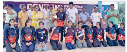
महेन्द्रगढ़। विजेता टीम को सम्मानित करते हुए।