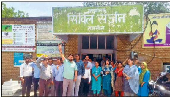
नारनौल। सेलरी नहीं मिलने के विरोध में प्रदर्शन करते हेल्थ एनएचएम कर्मचारी।

स्वास्थ्य विभाग में नेशनल हेल्थ मिशन के तहत काम कर रहे करीब 15 हजार कर्मचारी पिछले चार महीने से वेतन से वंचित हैं। महेन्द्रगढ़ जिले में भी करीब 500 एनएचएम हेल्थ कर्मचारी एवं चिकित्सक वेतन नहीं मिलने से आर्थिक तंगी से जूझ रहे हैं। कमाल की बात यह है कि ये कर्मचारी करीब 27 वर्षों से स्वास्थ्य विभाग में अपनी सेवाएं दे रहे हैं, लेकिन इन दिनों वेतन नहीं मिलने से आर्थिक संकट एवं मानसिक तनाव से जूझ रहे हैं। इसके विरोध में सोमवार को जिलेभर में हेल्थ कर्मचारियों ने दो घंटे विरोध प्रदर्शन किए और सरकार से वेतन जारी करने की मांग