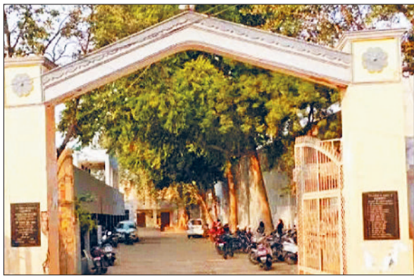
महेन्द्रगढ़। नगर पालिका कार्यालय महेन्द्रगढ़।