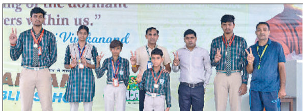
नारनौल। एचपीएस स्कूल में विद्यार्थियों को सम्मानित करते हुए।

गाटर पटी में से गाटर भी टूट गए। दुकान में भी काफी नुकसान हो गया। दुकानदारों ने बताया कि इतना ज्यादा नुकसान होने के बाद भी विधायक, जिला व उपमंडल प्रशासन के किसी अधिकारी ने आकर पीड़ित दुकानदार का हालचाल नहीं पूछा। इससे ऑटो रिपेयर मार्केट के दुकानदारों में भारी रोष व्याप्त है।