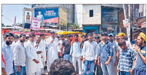
नारनौल। अमेरिका के खिलाफ प्रदर्शन करते विभिन्न संगठनों के सदस्य।

राष्ट्रीय स्वदेशी जागरण मंच की ओर से पूरे देश भर में अमेरिका की नीतियों के खिलाफ स्वदेशी के प्रति आग्रह बढ़ाने के लिए स्वावलंबी भारत कार्यक्रम के अंतर्गत प्रदर्शन किए जा रहे हैं। इस कड़ी में सोमवार को नारनौल जिला केंद्र पर एक प्रदर्शन किया गया। प्रदर्शन शहर के ऐतिहासिक आजाद चौक से शुरू होकर महावीर चौक तक किया गया। इस दौरान बाजार में व्यापारियों व ग्राहकों से मिलते हुए स्वदेशी के पत्रक वितरित किए व अमेरिका के खिलाफ तथा स्वदेशी के पक्ष में नारे लगाए गए। इस प्रदर्शन में स्वदेशी