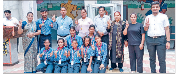
नारनौल। विद्या भारती स्कूल के विद्यार्थी।

तिरंगे को सम्मान देते हुए मार्च किया। पुलिसकर्मियों के साथ साथ बाइक राइडर्स और साइक्लिस्ट भी इस रैली में हिस्सा बने, जिससे इसका प्रभाव और भी बढ़ गया। सभी ने हाथों में तिरंगा झंडा लेकर शहर की मुख्य सड़कों से होकर मार्च किया। इस दौरान देशभक्ति के नारे गुंजते रहे, जिससे पूरे वातावरण में एकता और राष्ट्रीय गौरव की भावना भर गई। खास बात यह रही कि डीएवी पुलिस सप्लिक स्कूल के बच्चों ने भी तिरंगा लेकर इस यात्रा में भाग लिया, जिससे युवा पीढ़ी में देश प्रेम की भावना का संचार हुआ।